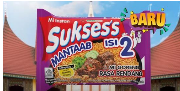
Gambar 17 Mi Instan Varian Baru

memberitahukan kepada penonton bahwasanya produk mi instan ini merupakan produk baru dengan cita rasa khas Sumatera Barat, yakni Rendang. Pada bagian latar pun, menampilkan bentuk rumah adat tradisional Sumatera Barat, yakni Rumah Adat Gadang (Gambar 17). Pada bagian selanjutnya menampilkan tayangan mi instan yang sudah matang dan siap disajikan, lengkap dengan Rendang di atasnya (Gambar 18).