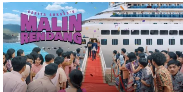
Gambar 13 Si Malin Turun dari Kapal

Pada tayangan iklan televisi mi instan Sukses's, cerita dimulai dengan adegan pertama Si Malin yang baru saja turun dari kapal (Gambar 1). Menurut cerita versi aslinya, Si Malin pulang ke tanah airnya bersama istrinya. Namun, disini diperlihatkan alih-alih membawa istrinya, dirinya malah pulang bersama dua asisten pribadinya. Dari sini dapat kita lihat perubahan yang terjadi dan nantinya akan mengubah esensi cerita walaupun tidak secara keseluruhan. Pada bagian ini merupakan bentuk strategi pengembangan plot yang bertujuan untuk masuk ke adegan berikutnya.