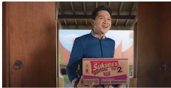
Gambar 15 Si Malin Membawa Sekardus Mi Instan Sumber: Youtube (2023)

Adegan berlanjut dan memperlihatkan Si Malin yang berlari kencang menuju ke rumah sembari membawa sekardus mi instan Sukses's (Gambar 15) kemudian menunjukkannya kepada Ibunya. Pada bagian ini, Ibunda Malin masih bertanya-tanya tentang apa yang dibawa anaknya tersebut (Gambar 16).