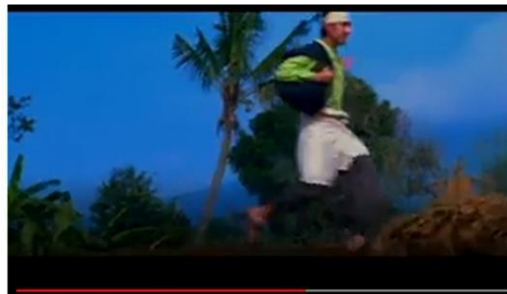
Gambar 6 Si Malin yang sedang berlari menghampiri ibunya

Adegan selanjutnya menggambarkan Ibunda Malin yang terkejut sekaligus bertanya kepada anaknya dan berkata, “Baru dua hari merantau, mengapa sudah pulang?”(Gambar 7). Hal ini menggambarkan bahwasanya terdapat pergeseran makna dari versi cerita aslinya. Yang mana pada cerita versi aslinya, Si Malin digambarkan merantau dan tidak pulang selama bertahun-tahun. Namun, dalam tayangan iklan ini Si Malin digambarkan hanya merantau selama dua