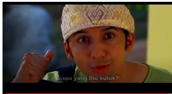
Gambar 11 Si Malin Bertanya Kepada Ibunya

Pada bagian terakhir, memperlihatkan Si Malin yang bertanya kepada Ibunya. Mengenai siapa yang telah Ibunya kutuk tersebut (Gambar 11). Karena seperti yang sudah kita ketahui bersama, bahwasanya Ibunya mengutuk Malin Kundang menjadi sebuah batu. Alih-alih Si Malin yang menjadi di batu, disini digambarkan dengan orang lain atau bahkan hanya batu biasa. Dilanjutkan dengan memperlihatkan sebuah batu yang menjadi ciri khas dari cerita Malin Kundang (Gambar 12).