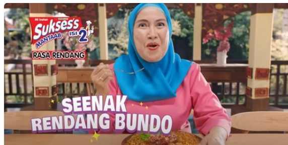
Gambar 20 Ibunda Malin Terkejut Akan Rasa Mi Instan Varian Rendang

Selanjutnya, terdapat adegan Ibunda Malin yang terkejut setelah mencicipi mi instan tersebut. Ibunda Malin mengatakan bahwasanya mi tersebut enak dan sama seperti masakan buatannya (Gambar 20). Dilanjutkan dengan kedua asisten Malin (Gambar 21) yang ikut memakan mi instan tersebut dan disusul dengan beberapa orang yang turut merasakan mi instan tersebut (Gambar 22).