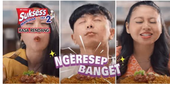
Gambar 22 Orang Lain Mencicipi Mi Instan

Terakhir, terdapat tayangan mi instan merek Sukses's yang belum dan sudah dimasak. Pada bagian ini memberikan penguatan kepada penonton akan promosi yang tengah dilakukan, yakni memperkenalkan mi instan varian baru, rasa khas Sumatera Barat, Rendang Sapi (Gambar 23).