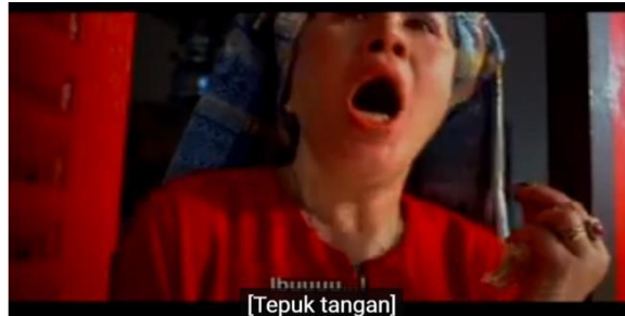
Gambar 4 Ibu Malin yang sedang terkejut mendengar suara anaknya

Adegan selanjutnya menggambarkan Ibunda Malin yang terkejut karena mendengar suara anaknya dari kejauhan, Si Malin (Gambar 4). Ternyata, suara tersebut memang berasal dari anaknya, Si Malin (Gambar 5). Kemudian dengan secepat kilat Si Malin berlari menghampiri ibunya (Gambar 6).