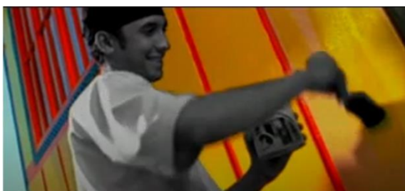
Gambar 3 Si Malin yang sedang mengecat dinding rumahnya menggunakan cat tembok merek Avian