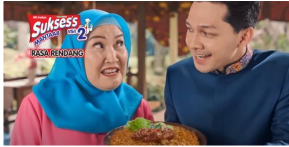
Gambar 19 Si Malin Menghidangkan Mi Kepada Ibunya

Selanjutnya, terdapat adegan Ibunda Malin yang terkejut setelah mencicipi mi instan tersebut. Ibunda Malin mengatakan bahwasanya mi tersebut enak dan sama seperti masakan buatannya (Gambar 20). Dilanjutkan dengan kedua asisten Malin (Gambar 21) yang ikut memakan mi instan tersebut dan disusul dengan beberapa orang yang turut merasakan mi instan tersebut (Gambar 22).