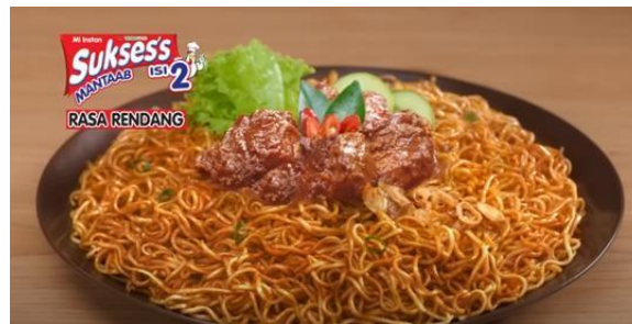
Gambar 18 Mi Instan yang Sudah Siap Makan

Adegan selanjutnya, memperlihatkan Si Malin yang telah menghidangkan sepiring mi instan rasa Rendang tersebut kepada Ibunya. Pada bagian ini, Ibunya berkata, “Kamu nanya?” (Gambar 19). Seperti yang sudah kita ketahui bersama, bahwasanya kata-kata tersebut merupakan kata-kata trending yang masih hangat sampai saat ini. Hal ini menunjukkan bahwasanya iklan yang ingin ditampilkan tidak lepas dari bentuk trend pada masa itu.