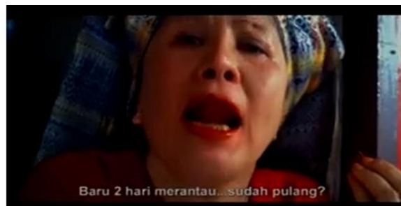
Gambar 7 Ibu Malin bertanya kepada anaknya

hari (Gambar 8). Alasan Si Malin tidak kuat merantau karena dia sangat merindukan rumahnya yang indah. Selanjutnya, terdapat adegan ketika menyoroti rumahnya yang digambarkan secara bagus dan indah (Gambar 9). Hal ini menggambarkan bahwasanya cat tembok merek Avian mampu menjadikan rumah menjadi lebih indah. Tak hanya itu, rumah Si Malin digambarkan dengan bentuk rumah adat tradisional Sumatera Barat, yakni Rumah Gadang. Hal ini menunjukkan bahwasanya unsur-unsur intrinsik kecil ini masih diperhatikan dalam tayangan iklan agar tetap berpegang teguh pada cerita rakyat versi aslinya yang memang berasal dari Sumatera Barat.