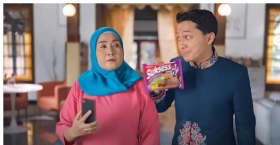
Gambar 16 Si Malin Memperlihatkan Mi Instan Kepada Ibunya

Selanjutnya, terdapat tayangan produk Mi Instan Sukses's yang dipromosikan oleh narator dan