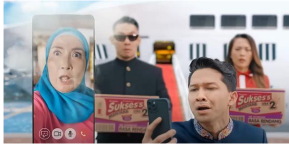
Gambar 14 Si Malin Ditelpon Ibunya

Adegan berlanjut dan memperlihatkan Si Malin yang berlari kencang menuju ke rumah sembari membawa sekardus mi instan Sukses's (Gambar 15) kemudian menunjukkannya kepada Ibunya. Pada bagian ini, Ibunda Malin masih bertanya-tanya tentang apa yang dibawa anaknya tersebut (Gambar 16).