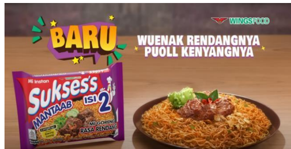
Gambar 23 Mi Instan yang Sudah Siap Dimakan

Terakhir, terdapat tayangan mi instan merek Sukses's yang belum dan sudah dimasak. Pada bagian ini memberikan penguatan kepada penonton akan promosi yang tengah dilakukan, yakni memperkenalkan mi instan varian baru, rasa khas Sumatera Barat, Rendang Sapi (Gambar 23).