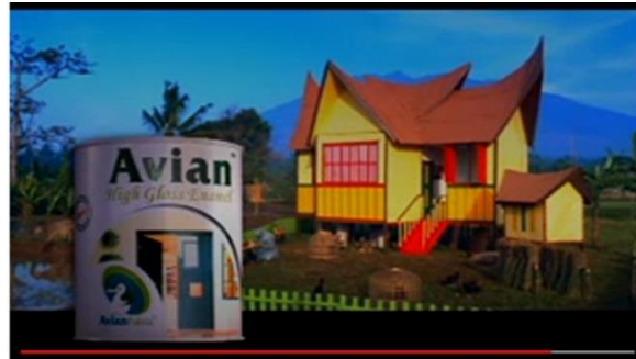
Gambar 10 Cat Tembok Avian dan Rumah Si Malin

Pada bagian selanjutnya, diperlihatkan secara utuh bentuk dari cat tembok merek Avian yang berdampingan dengan rumah Si Malin. Hal ini membuktikan bahwasanya rumah Si Malin memiliki warna yang indah dan nyaman dipandang karena menggunakan cat tembok merek Avian (Gambar 10).