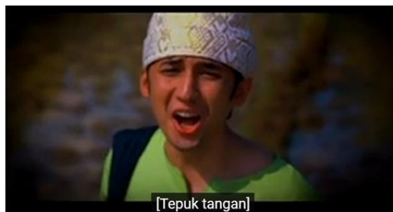
Gambar 5 Si Malin yang sedang berteriak memanggil-manggil ibunya