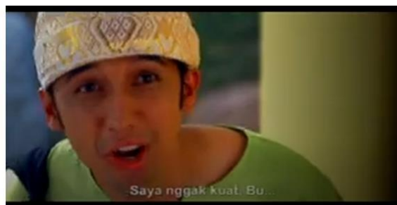
Gambar 8 Si Malin tidak kuat merantau