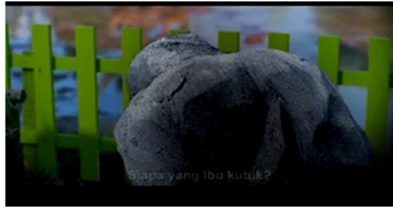
Gambar 12 Batu di Samping Pagar