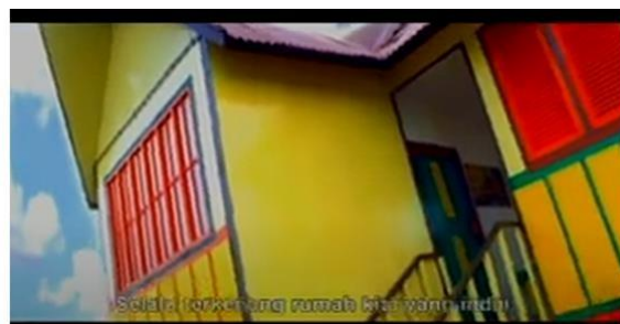
Gambar 9 Rumah Si Malin