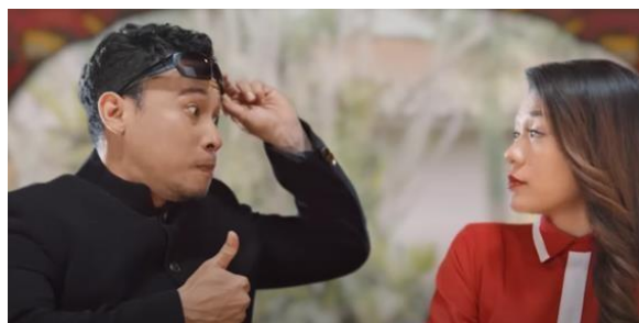
Gambar 21 Asisten Si Malin Mencicipi Mi Instan